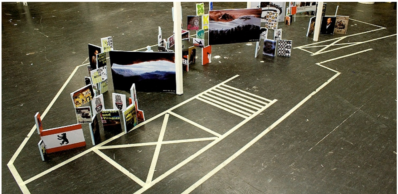
Abbildung: 1:10 Modell auf dem Grundriss des Kulturforums im Atelier der Projektgruppe

unterstützt durch die Studienwerkstätten der Kunsthochschule in Kooperation mit Nauka Kirschner (100 Beste Plakate e.V.)